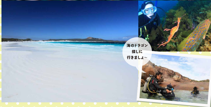
海のドラゴン 探しに 行きましょ～